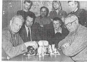
• De schakers van Barendrecht die bijna kampioen zijn.