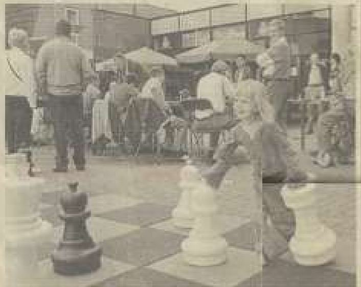
Als menje probeert een... (text continues, partially obscured by image)

De... (text continues, partially obscured by image)