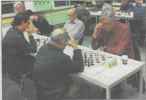
Feest dit jaar voor de Barendrechtse schakers.