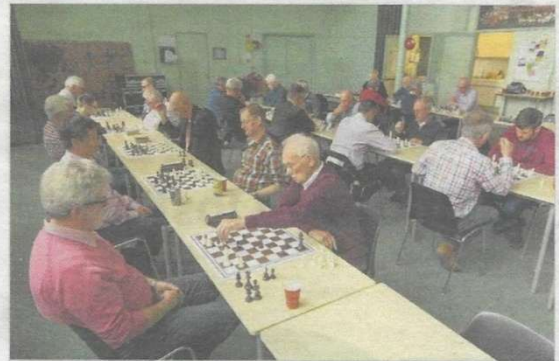
Uiteraard werd er geschaakt tijdens de reünie.

bestaan heeft de schaakclub steeds in de Rotterdamse Schaakbond (RSB) gespeeld. In 1991 lonkte promotie naar de landelijke klasse, maar het toenmalige sterke jeugdteam strandde op een luttel aantal bordpunten. Het eerste team speelt nu bovenaan in de eerste klasse.