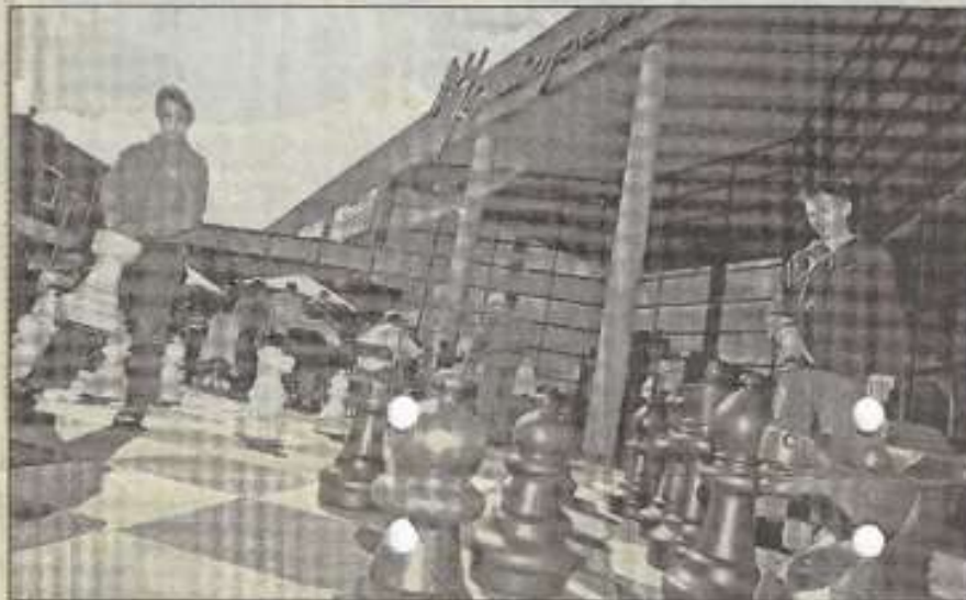
Iedereen kon een partijtje schaak spelen op het reserveschakbord bij Het Kruispunt.